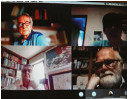
Riunione on line dell'Ufficio di Presidenza