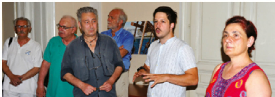
Nella foto, i fiumani di San Vito degli anni scorsi

diventarono improvvisamente mansueti e gli leccarono i piedi. Vito, Modesto e Crescenza, narra la leggenda, vennero poi legati ad un cavalletto, ma mentre le loro ossa venivano straziate, la terra cominciò a tremare e gli idoli caddero a terra; lo stesso Diocleziano fuggì spaventato. Comparvero degli angeli che li liberarono e trasportarono presso il fiume Sele, dove essi ormai sfiniti dalle torture subite, morirono il 15 giugno 303; non si è riusciti a definire bene l'età di Vito quando morì, alcuni studiosi dicono 12 anni, altri 15 e altri 17.